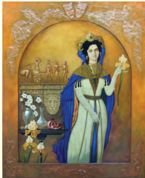
Олександр Мельников. «Портрет С. Крушельницької у ролі Аїди». Оргалит, левкас, олія. 2017.