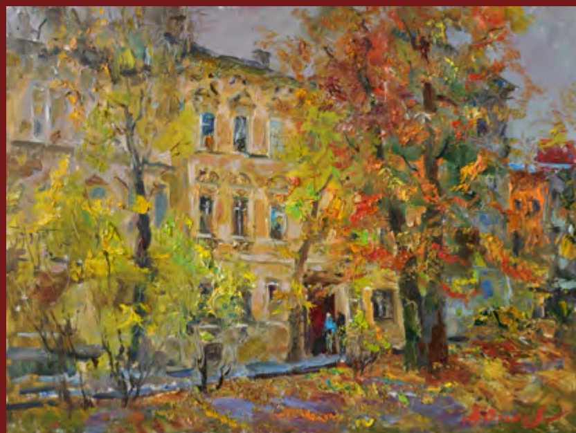
На першій сторінці обкладинки: Віктор Горяєв. «Дива». Полотно, олія, пастель, золота поталь. 2017. Дизайн видання: Андрій Будник. www.budnyk-design.com