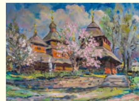
Богдан Бринський. «Церква XVII ст. у Сколе». Полотно, олія. 2017.