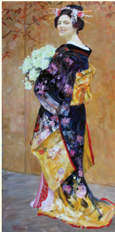
Панас Титенко. «Соломія Крушельницька. Чіо-Чіо-сан». Полотно, олія. 2017.

На виставці представлені картини наступних художників: Б. Бринський, В. Горяєв, Т. Красна, О. Мельников, К. Могилевський – заслужений художник України, О. Ольхов – заслужений художник України, А. Потурайло, І. Проценко, П. Титенко, О. Храпачов, О. Яковенко.