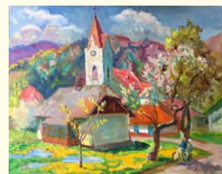
Тетяна Красна. «Костьол у Сколе». Полотно, олія. 2017.