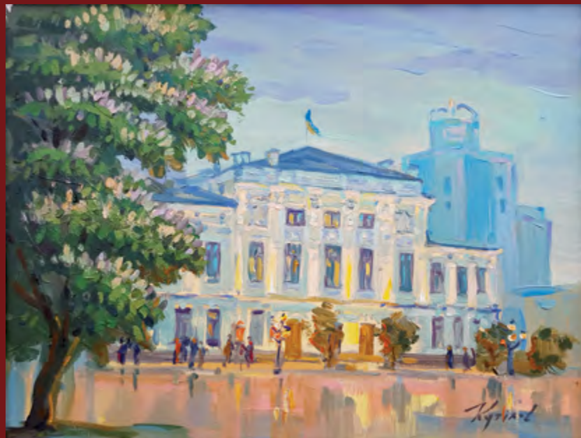
Юрій Кутилов. «Театр оперети». Полотно, олія. 2017.